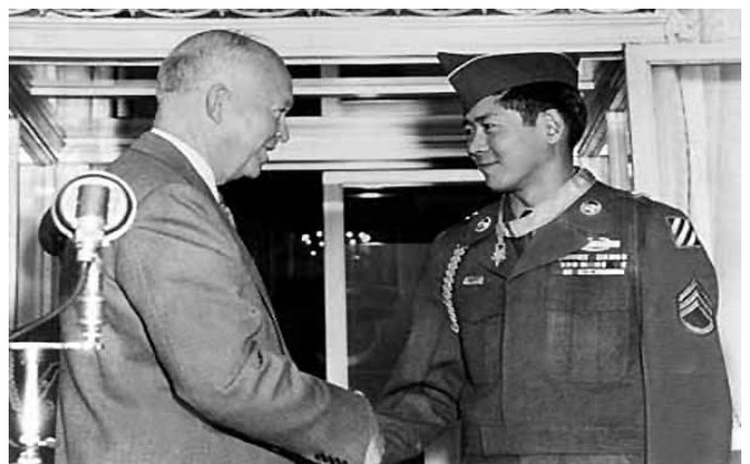
미야무라 하사가 아이젠하워 대통령으로부터 무공훈장을 받게 될 것이라는 정보는 포로교환으로 귀환하기 전까지는 극비에 부쳐졌다고 한다.

(참고기사 : 알버커키 저널, “NM hero to be a grand marshal at NYC parade” Thursday, November 7th, 2019) ■