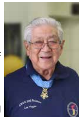
2016년 뉴멕시코한인회 행사에 참석하셨던 미야무라 씨

뉴욕에서 인터뷰를 통해 미야 무라 씨는 “한국전 참전 용사들을 대표하는 그랜드 마샬로 초대받아 영광입니다.”라고 했다. “많은 사람이 우리가 겪은 전쟁을 잘 이해하지 못하고 있습니다. 한국 전쟁이 언제 시작되었는지조차 모르는 사람들이 많이 있습니다.”라고 하면서 94세인 미야 무라씨는 “나는 ‘나 자신과 하나님과 이 나라를 믿습니다’라는 말로 인생을 살려고 노력해 왔습니다.