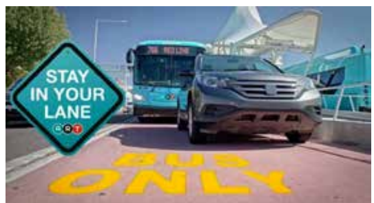
위와 같은 경우 차선 위반으로 티켓을 받을수있다.

ART 차선에서 운전하거나 좌회전을 하기 위해 교차하는 사람은 적어도 $ 80 티켓을받을 수 있다고 말한다. 두 위반을 저지른 운전자는 총 $ 160의 티켓 두 장을받을 수도 있다. ■